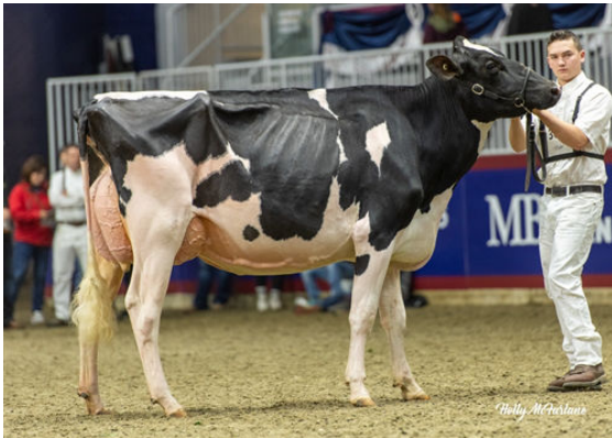
DANDYLAND ATEAM LALA DAUGHTER